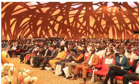
Une vue des Participants à la 2eme Edition

Ce forum a été créé pour répondre à plusieurs objectifs entre autres, encourager la participation des jeunes dans la cacaoculture,