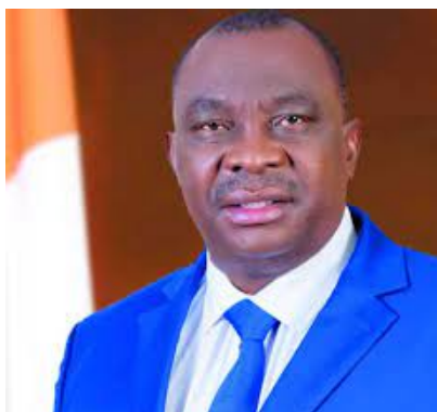
Kobenan ADJOUANI Ministre de l'Agriculture et du Développement Durable

Les différentes filières agricoles surtout celles du café-cacao, du coton et de l'anacarde sont des axes qui interviennent dans le développement économique national. Ainsi, pour parer à toute éventualité, le Gouvernement ivoirien a prévu des sanctions ainsi qu'un mécanisme de prévention à l'échelon local pour contrer durablement la commercialisation et l'exportation illicites de ces produits agricoles soumis à agrément. Ainsi, sans préjudice des sanctions en vigueur, notamment celles prévues par le Code pénal, les personnes qui pratiquent ces activités illicites encourent la confiscation au bénéfice de l'Etat, des objets et produits des infractions, le retrait du passeport, de l'agrément et la suspension du permis de conduire. Par ailleurs, il est institué, dans chaque région frontalière de la Côte d'Ivoire, un comité régional de lutte contre la commercialisation et l'exportation illicites de pro-